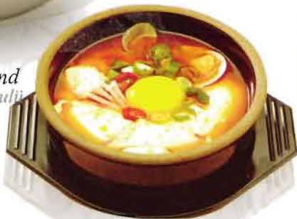
Soon du bu : Rice and soft tobu stew (kore usulü fasulyeli çorbasi) 12YTL