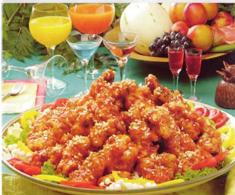
Dak Kang Jung : cake make from chicken with sauce (kore usulü soslu tavuk keki) 20YTL