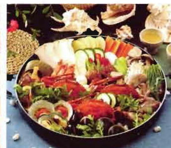
Hae mul jeon gol : Seafood casserole (güveçte pişirilmiş deniz mahsulleri) M: 35YTL R: 48YTL