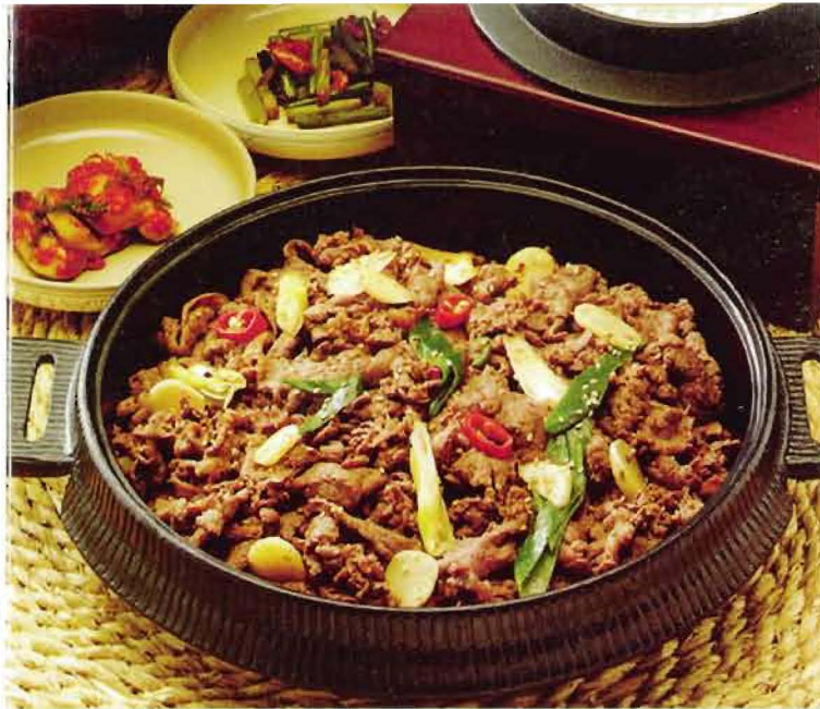
Bul ko gi : Beef marinated in soy sauce (kore usulü soslu dana eti) 24YTL