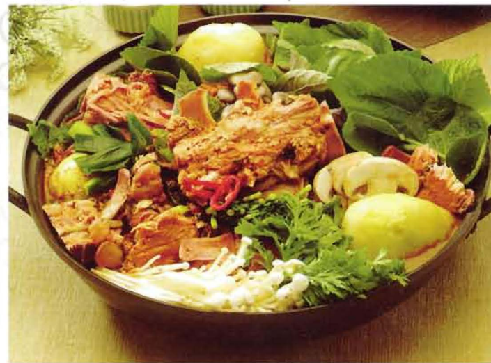
Gam ja tang : Potato stew and pig backbone (meat & potato soup-etli patates çorbasi) M: 38YTL R: 49YTL