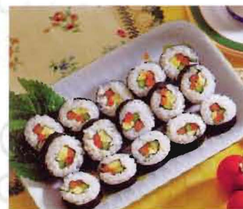
Kimbob : korean style roll (kore usulü sushisi) 15YTL