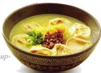
Man doo gook : Korean dumpling soup (dumpling soup-kore usulü mantı çorbasi) 14YTL