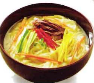
Kal guk su : handmade knife-cut noodles (kore usulü çorbali ve eriştesi) 10YTL