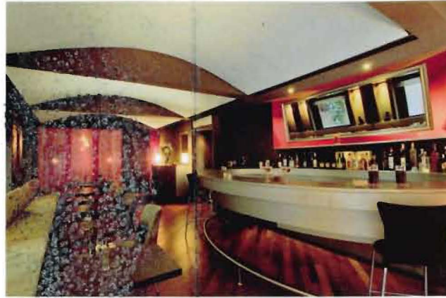
café & bar